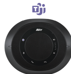
Microsoft Teams edition