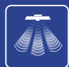
Công nghệ Beamforming