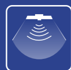
Hàng rào âm thanh AVer