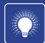
Hệ thống đèn chiếu sáng thông minh